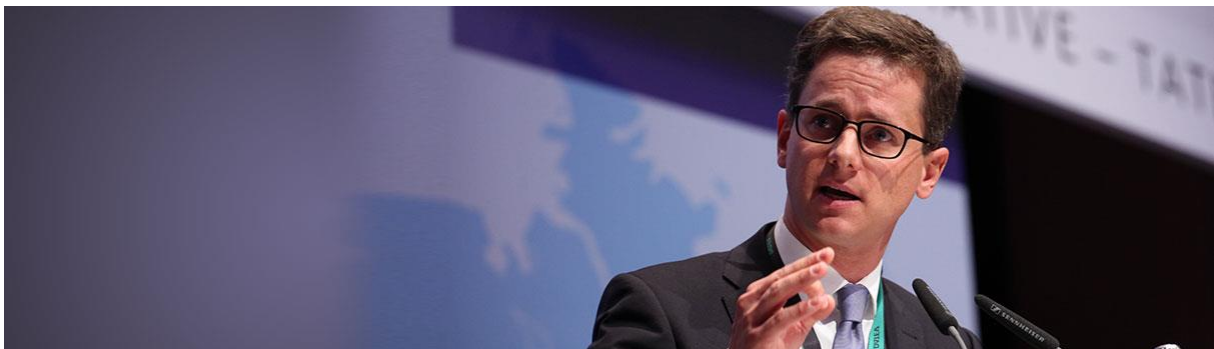
Referent 2016: Dr. Carsten Linnemann, MdB, Vorsitzender der Mittelstandsvereinigung der CDU/CSU